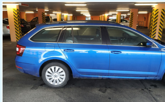
Chybí pravá přední část vozu