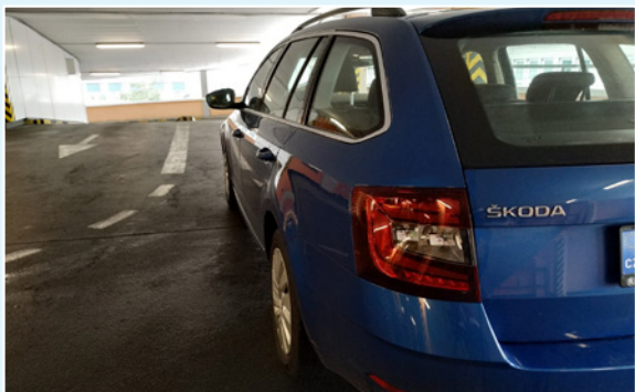
Fotografie z úhlu – nelze rozpoznat, zda je poškozeno